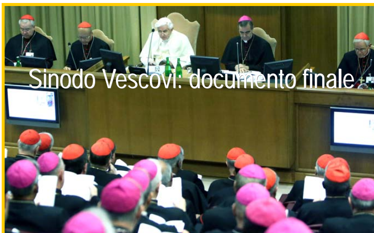
Sinodo Vescovi: documento finale